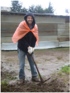
Volontär hilft beim Bau der Grundschule in La Cipsesada

Anmeldung ist erst möglich, wenn wir eine Tätigkeitsbeschreibung gefunden haben, die dir zum einen zusagt und zum anderen deinen Fähigkeiten entspricht. So können beide Seiten am meisten profitieren.