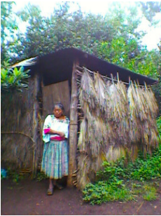
Frau vor ihrem Haus in unserer aktuellen Projektgemeinde Belejú, Quiché