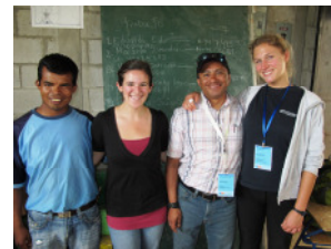
Volontäre in unserer derzeitigen Projektgemeinde Belejú, Quiché

Da uns Sicherheit und Wohlbefinden unserer